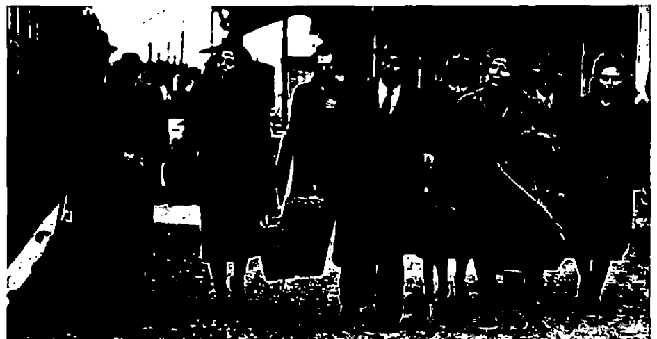
Le Voyage des comédiens (O Thiasos).

Les comédiens, la nuit, cachés dans une rue au bout de laquelle s'ouvre perpendiculairement une avenue. Deux groupes armés s'y affrontent : les combattants s'avancent de part et d'autre, tirent, tombent, refluent, reviennent, disparaissent. Restée fixe, la caméra n'a cadré que quelques comédiens tapis dans l'ombre, une partie de la rue et le carrefour. De qui s'agit-il, qui a gagné, y a-t-il même un vainqueur ? Nous n'en savons pas plus, et pas autrement, que les comédiens eux-mêmes : spectateurs immobiles dans l'obscurité, par deux fois.